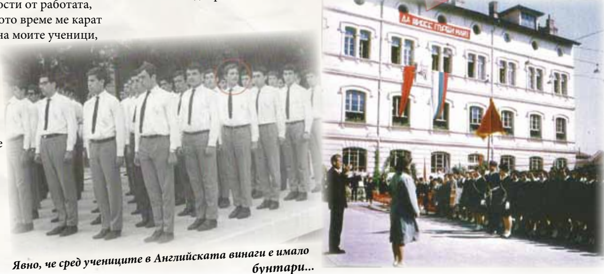
Явно, че сред учениците в Английската винаги е имало бунтари...

Поздрав за откриването на учебната година