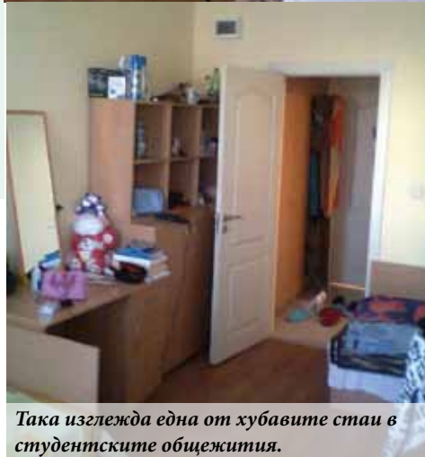
Така изглежда една от хубавите стаи в студентските общежития.