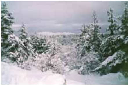
Зимен изглед от „Овчарски поляни“

Скоро студът съвсем ще си отиде, природата ще се съживи и Родопите отново ще се превърнат в място, подходящо за любителите на разходките в планината. Ще ви разкажа за няколко места, които посетих през изминалата година – някои посетих със семейството си, а други – с моите приятели или както аз ги наричам – обичайните заподозрени.