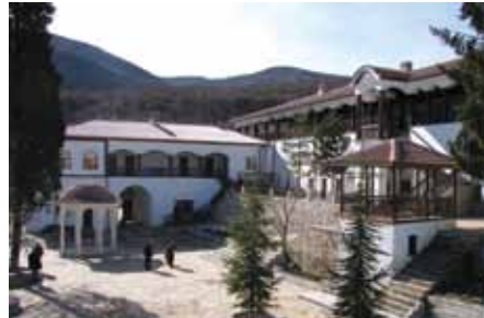
Изглед от манастира „Св. Св. Козма и Дамян“.

„Беланташ“ („Белънташ“, среща се и като „Белинташ“) е красива скала с форма на малко плато в Родопите, носеща следи от човешка дейност – името му означава „Белият камък“. От Асеновград се тръгва в посока Кърджали, отбива се вдясно през с. Червен, минава се през с. Горнослав, след това през с. Орешец. На разклона за с. Мостово се продължава направо (Мостово е надясно), стига се до разклона за