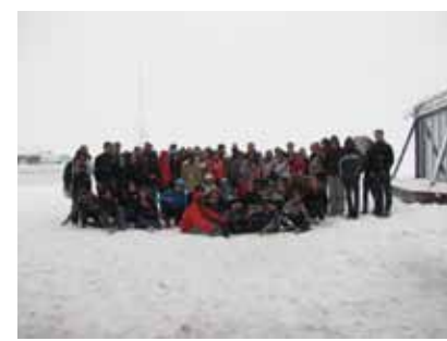
на връх Цугшпитце