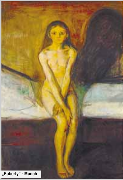
„Puberty“ - Munch

„Алилуя“ – пропичия будилникът на GSM-а. Тя стреснато отвори очи. Нервно започна да търси телефона из леглото и едва успя да го изключи в тъмното. Много пъти беше сънувала този сън, но никога толкова ясно. Няколко минути стоя неподвижно, загледала към прозореца. След това рязко се изправи и разтърка очи. Стисна главата си с ръце, сякаш да отпъди мислите си. Погледът ѝ разсеяно се рееше из стаята. Изведнъж той се спря на календара на стената. 25 декември. Тя не можеше да повярва на очите си. Найсетне успя да разбере съня си. Беше дошло време да го направи. После се изкъпа, облече белия си халат и излезе от мрачния апартамент. Босите ѝ крака бавно и елегантно се движеха нагоре по бетонните стълби. Стигна до последния етаж и отвори вратата, водеща към покрива. Ослепителна светлина нахлу откъдето тя присви очи. Никога светът не ѝ беше струвал толкова светъл. Слънцето току-що бе