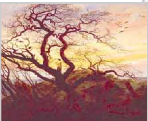
„Tree with Crows“ - Friedrich