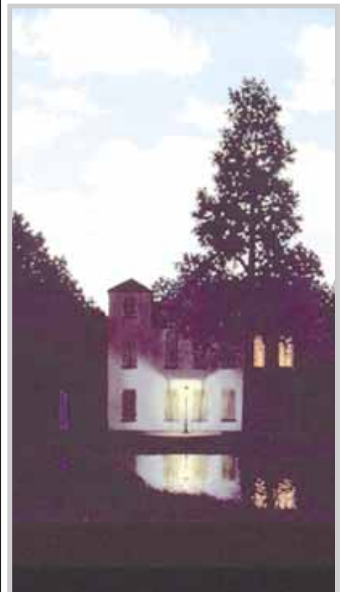
„L'Empire des Lumieres“ - Magritte

Усмивката ведра ти му подари подай му своя къшей хляб Поискай то да те благослови с неговото тъжно „Джаф!“