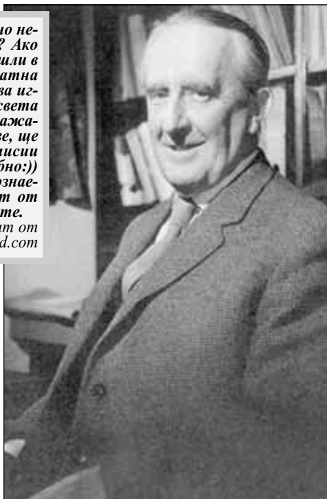
Дж. Р. Р. Толкин - авторът на „Властелинът на пръстените“

Готови ли сте за едно невероятно приключение? Ако е така, тогава добре дошли в Двете Кули - безплатна Multiplayer онлайн ролева игра, която се развива в света на Толкин. Тук ще се сражавате със свирепи врагове, ще отивате на опасни мисии (quests, ако ви е по-удобно!) и разбира се, ще се запознаете с много хора, с част от които ще се сприятелите. превод на цитат от http://t2tmud.com