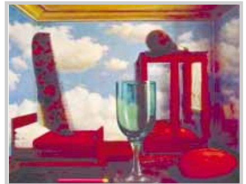
„Birthday“ - Chagall

Той е до мен. В същото легло, под същата завивка. А аз съм сама. По сама от всякога... Усещам горещото му тяло, а треперя. Самотно и пусто е в душата ми. Вее хлад.