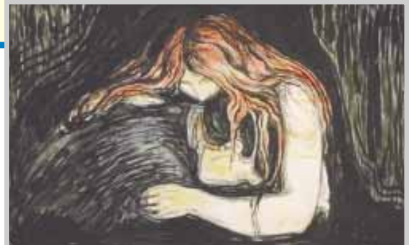
„Vampire“ - Munch