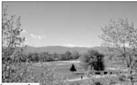
Изглед към двора на училището ни