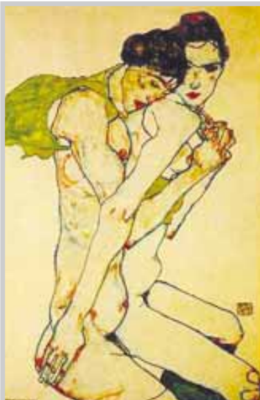
„Freundschaft 1912“ - Schile

Боли ме, как в тези празни очи любов не се роди, боли ме, как в това пусто сърце страстта умря вече, гледам, а празнотата сякаш и мен безмълвно ме покори! и пак самотата ме прегръща, а ти си далече,