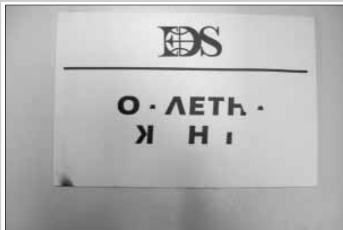
Забележете: има прозрес!!